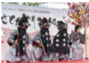
比曽の三匹獅子舞