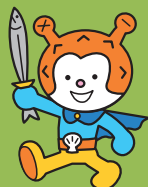
気仙沼市観光キャラクター 「海の子 ホヤぼーや」